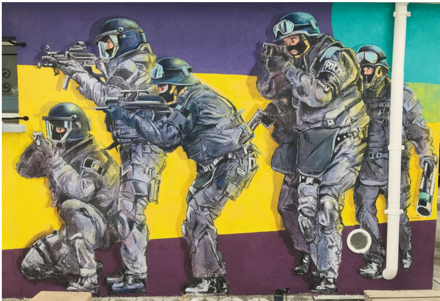
La fresque en hommage à Peter K. montre des policiers en nombre, passant à côté d'un renard, animal rusé censé symboliser le mathématicien à la retraite qui avait défrayé la chronique pendant 10 jours en 2010. GEORGES RECHBERGER

La météo idyllique, la mer, accueillante toute l'année et la richesse féconde d'une culture